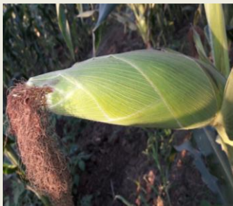
Figura 1: Cultivo de Milho.

Feita análise comparativa do preço médio do milho praticado nos mercados monitorados pelo SIMA no país, nos meses de Março de 2016 a 2018 é duma modo geral, mais caro nos mercados dos distritos da região sul do país “Figura 2” e mais barata em alguns distritos da região norte e centro do país “Figura 3”.