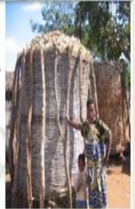
Produtor do distrito de Cuamba preocupado em saber o preço e onde pode vender o seu milho que está a se estragar no colmo