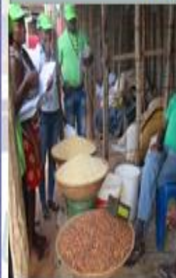
Equipe de inquiridores do SIMA recolhendo preços de produtos comercializados no mercado do Distrito da Massingao

O SIMA recolhe preço de produtos desde 1991 junto aos produtores, grossista e retalhista, que desenvolvem as actividades nos distritos, por meio de 114 técnicos com formação média e superior, treinados para exercer actividade.