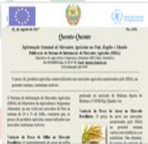
Edição nº Nº. 1151 do boletim Semanal "Quente-Quente" que dá informação de Mercados Agrícolas do País e Mundo