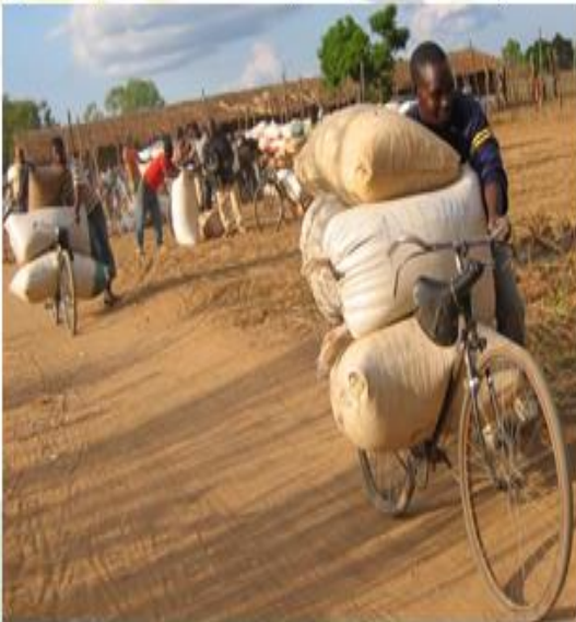
Comerciante grossista durante a compra de produtos ao produtor no distrito de Mandimba.