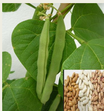
Figura 1: Feijão Manteiga.

O feijão manteiga é uma leguminosa consumida por quase toda a população moçambicana. Segundo informação dos praticantes de negócio de feijão monitorados pelo SIMA, mais de 50% deste produto que é comercializado no mercado nacional é proveniente da produção nacional.