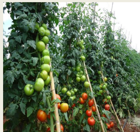
Figura1: Cultivo de tomate de variedade melhorada.

Segundo Instituto de Investigação Agrária de Moçambique-IIAM, as variedades melhoradas de tomate (HTX, KIARA, NAGAIA)