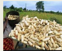
Quadro 1: Preço do milho e sua variação percentual.

Retalhista: O comportamento do preço de milho que é vendido a retalhe na presente semana nos mercados monitorados pelo SIMA, variou com tendência a se estabilizar com excepção de alguns mercados conforme ilustra o “Quadro 1”.