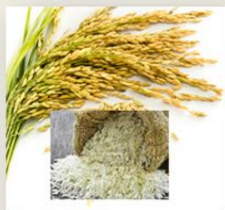
Quadro 1: Preço do arroz e sua variação percentual.

Retalhista: O preço do arroz ao retalhista nos mercados monitorados pelo SIMA na presente semana tendem a baixar, no entanto, regista subida nos mercados de Gorongosa e Cuamba como ilustra o “Quadro 1”.