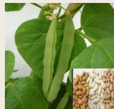
Variação do Preço de Feijão manteiga no Mercado Retalhista: O preço a retalhe do feijão

manteiga na presente semana variou. No quadro 3 vê-se os mercados que apresentam variação na presente semana.